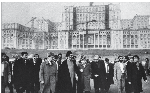
سفر آیت‌الله خامنه‌ای به رومانی، یوگوسلاوی، بلغاراد و سارایوو میدان اصلی بخارست، اسفند ۱۳۶۷

حضرت هادی (ع) چهل و دو سال عمر کردند که بیست سالش را در سامرا بودند... در همین شهر سامرا عده‌ی قابل توجهی از بزرگان شیعه در زمان امام هادی (ع) جمع شدند و حضرت توانست آنها را اداره کند و به وسیله‌ی آنها پیام امامت را به سرتاسر دنیای اسلام برساند. این شبکه‌های شیعه در قم، خراسان، ری، مدینه، یمن و در مناطق دوردست و در همه‌ی اقطار دنیا را همین عده توانستند رواج بدهند و روز به روز تعداد افرادی را که مؤمن به این مکتب هستند، زیادتر کنند. امام هادی همه‌ی این کارها را در زیر برق شمشیر تیز و خونریز همان شش خلیفه و علی‌رغم آنها انجام داده است. حدیث معروفی درباره‌ی وفات حضرت هادی (ع) هست که از عبارت آن معلوم می‌شود که عده‌ی قابل توجهی از شیعیان در سامرا جمع شده بودند؛ به گونه‌ای که دستگاه خلافت هم آنها را نمی‌شناخت. ● ۸۳/۵/۲۵