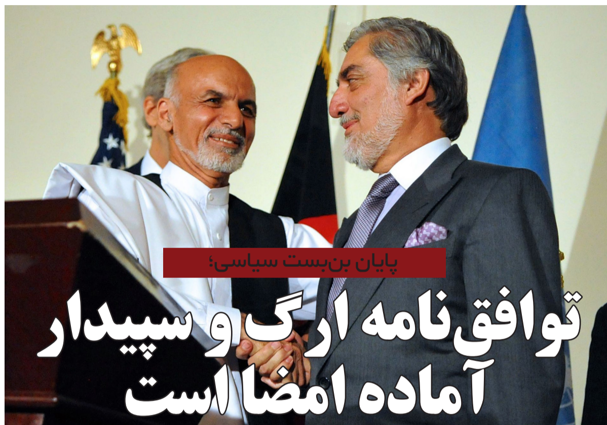
پایان بن بست سیاسی؛

تنور جنگ فزینگی و تبلیغاتی بین نیروهای امنیتی و طالبان در روزهای گذشته نسبت به ماههای گذشته داغ تر شده است. ماشین جنگی دولت افغانستان در برابر طالبان پس از آن روشن شد که رییس جمهور کشور در دیدار از فرماندهی عملیات خاص نیروهای ویژه ارتش، از آنان خواست که «شمشیر از نیام برکشند» و قوت نیروهای خاص را به آنان نشان دهند. تغییر موضع رییس جمهور کشور در قبال طالبان، پای نیروهای امنیتی را به میدان کشاند و آنان هم با حمایت از تصمیم جدید دولت و با اشاره به حمله هفته پیش در کابل و ننگرهار، طالبان را متهم به استفاده از روش «حمله و تکیب» کردند. از آن طرف برخی تحلیلگران امریکایی وضعیت موجود را به ضرر افغانستان می دانند و از دو طرف خواهان تلاش برای دست یابی به صلح اند.