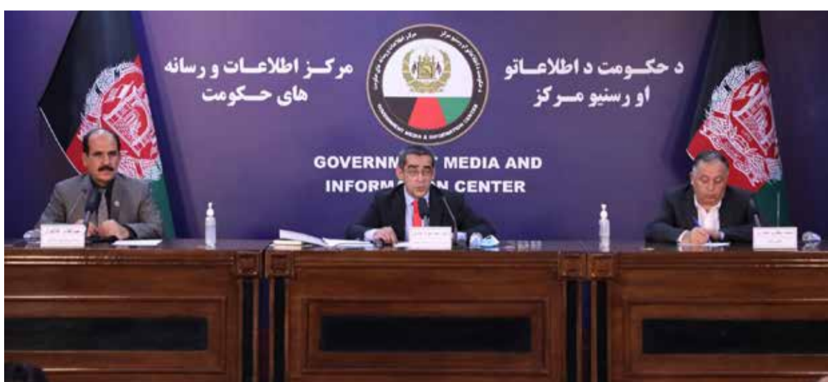
تعهدات وزارت صحت:

شورای ولایتی ولایت غزنی از تحرکات طالبان در این ولایت ابراز نگرانی می‌کند. اعضای این شورا می‌گویند که طالبان از چندین سو در این ولایت تحرکاتشان را افزایش داده‌اند. علاوه بر این، آن‌ها می‌گویند گزارش‌هایی وجود دارد که به تازگی شماری از جنگ‌جویان خارجی در این ولایت دیده شده و در بعضی از ولسوالی‌های این ولایت تجمع دارند. آن‌ها تصریح می‌کنند که طالبان پلان دارند تا یک حمله گسترده را بر شهر غزنی راه‌اندازی کنند. آن‌ها هشدار می‌دهند، در صورتی که پلان برای خنثا کردن این حملات سنجیده نشود، ممکن است ولایت غزنی همانند سال ۱۳۹۷ سقوط کند. در همین حال سخنگوی والی غزنی هرچند تحرکات گروه طالبان را در این ولایت رد نمی‌کند، اما می‌گوید که نیروهای امنیتی آماده دفاع از این ولایت‌اند.