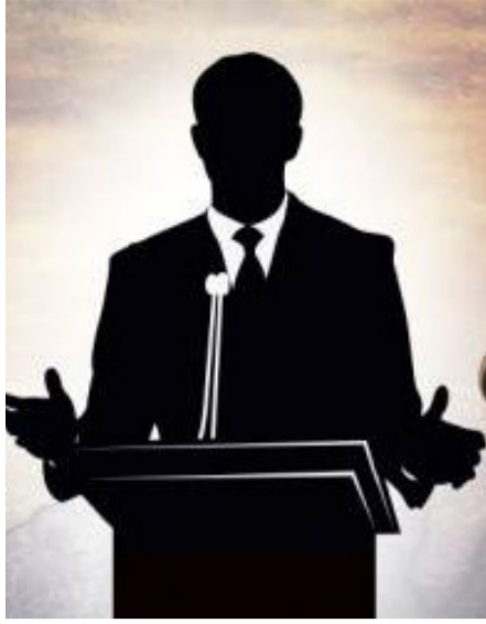
نویسنده: آرلین کانسک