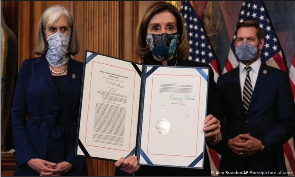
کنند. ترامپ اولین رییس جمهوری امریکاست که دو بار مورد استیضاح قرار می‌گیرد. نخستین مورد استیضاح او به اتهام سوءاستفاده از قدرت بود که در مجلس سنار شد.

مجلس نمایندگان امریکا مصوبه استیضاح ترامپ را رسماً به مجلس سنا تقدیم کرد. بررسی این استیضاح روز ۹ فبروری آغاز می‌شود. ترامپ از سوی قانون‌گذاران ایالات متحده متهم به «تحریک به شورش» شده است. دومین مصوبه استیضاح دونالد ترامپ رییس جمهوری پیشین ایالات متحده امریکا رسماً تقدیم مجلس سنا شد. نمایندگان مجلس قانون‌گذاری در این مصوبه ترامپ را به «تحریک به شورش» متهم کرده‌اند. بررسی استیضاح ترامپ در سنا روز ۹ فبروری آغاز می‌شود. دموکرات‌ها ترامپ را مسئول حمله هوادارانش به کنگره در روز ششم جنوری می‌دانند. در جریان این حمله پنج نفر از جمله یک پولیس کشته شدند. هرچند ترامپ دیگر رییس جمهوری نیست، اما در صورت پذیرش این استیضاح از سوی سنا او برای تمام عمر از داشتن مسئولیت در دولت فدرال محروم می‌شود. در روند بررسی استیضاح، نمایندگان سنا نقش هیأت منصفه را دارند و باید درباره محکوم کردن یا نکردن ترامپ به اتهامی که نمایندگان مجلس قانون‌گذاری به او وارد کرده‌اند، تصمیم بگیرند. به این منظور باید دو سوم نمایندگان به استیضاح رأی مثبت بدهند. به این ترتیب حداقل ۱۷ نماینده جمهوری خواه به اضافه تمامی سناتورهای دموکرات باید با استیضاح موافقت