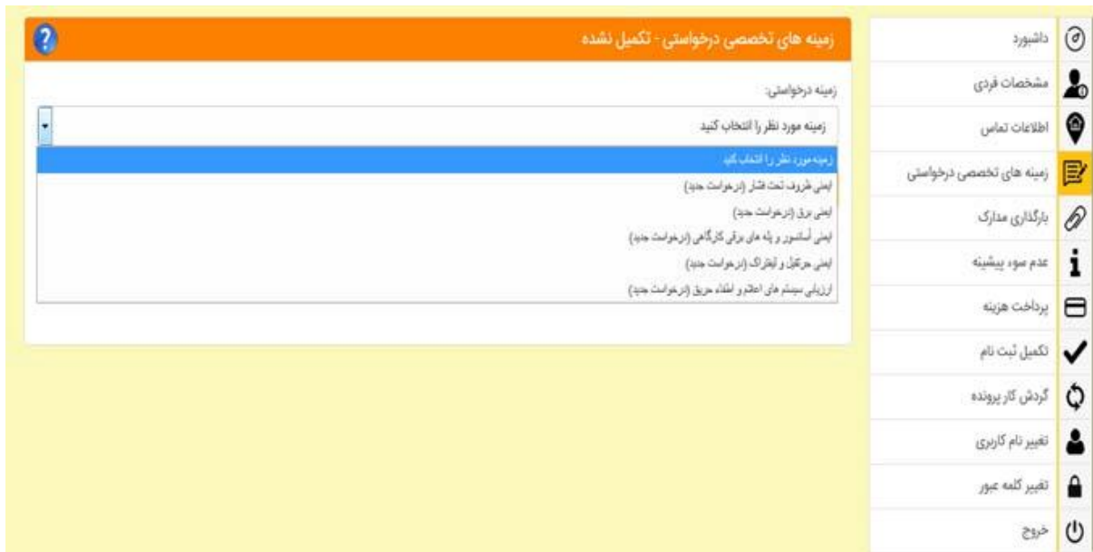
شکل 10- درخواست زمینه‌ها برای متقاضیان عنوان کارشناس فنی مجاز

که متقاضی بنا به مطالب فوق الاشاره در خصوص رشته تحصیلی و سوابق اجرایی باید نسبت به انتخاب زمینه حداکثر در 2 مورد اقدام کند.