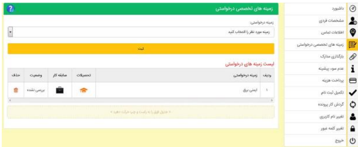
شکل 11- جدول زمینه‌های تخصصی درخواستی

که متقاضی بنا به مطالب فوق الاشاره در خصوص رشته تحصیلی و سوابق اجرایی باید نسبت به انتخاب زمینه حداکثر در 2 مورد اقدام کند.