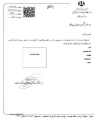
شکل 13- گواهی عدم سوء پیشینه

3-4-4-5 - عدم سوء پیشینه: متقاضی باید معرفی نامه جهت مراجعه برای اخذ گواهی عدم سوء پیشینه از مراکز پلیس +10 یا تشخیص هویت (در صورت نیاز) را بعد از بارگذاری عکس پرسنلی در قسمت «بارگذاری مدارک» از محل «دانلود معرفی نامه» دانلود نماید (شکل 13). سپس با مراجعه به مراجع ذیربط و اخذ گواهی عدم سوء پیشینه، مشخصات گواهی صادره شامل «شماره گواهی» و «تاریخ صدور گواهی» در همین قسمت درج نموده و «تصویر گواهی» را نیز در همین صفحه بارگذاری نماید (شکل 14). تاریخ اعتبار گواهی عدم سوء پیشینه حداکثر 1 ماه بعد از تاریخ صدور آن می باشد.