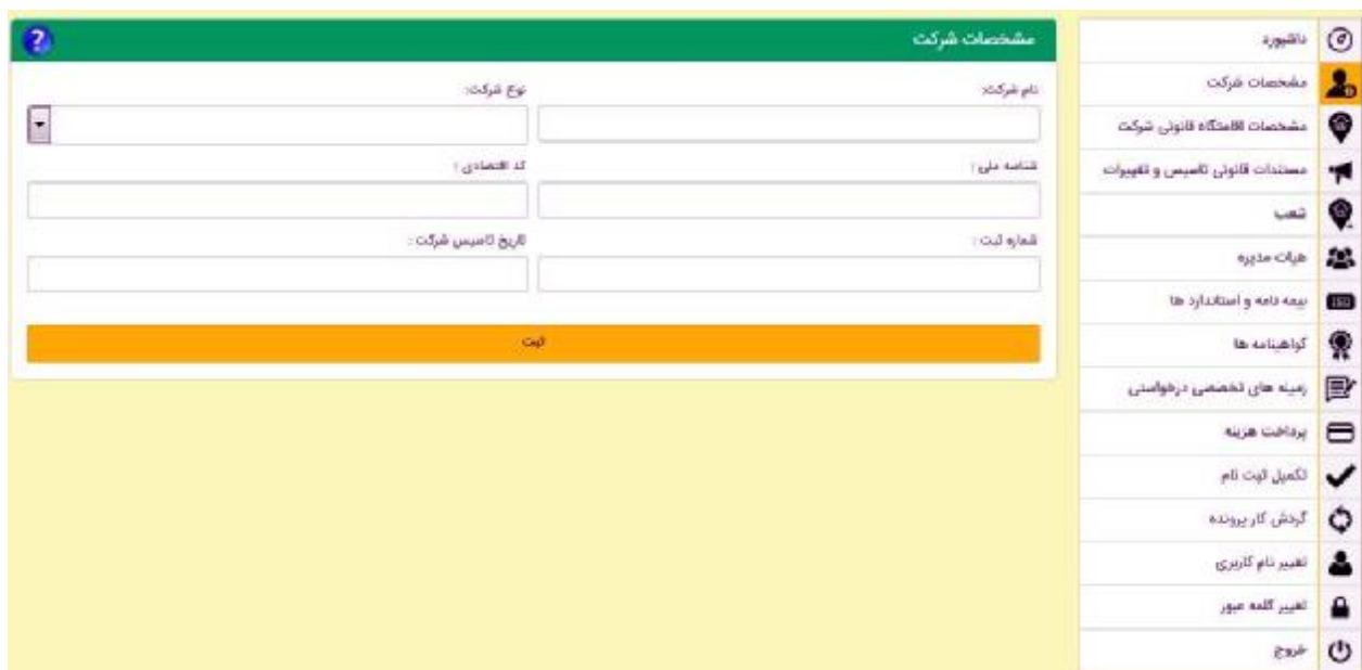
شکل 19- مشخصات شرکت

4-4-1- مشخصات شرکت: در این قسمت متقاضی باید مشخصات شرکت شامل: نام شرکت، نوع شرکت، شناسه ملی، کد اقتصادی، شماره ثبت و تاریخ تاسیس شرکت را وارد کند.