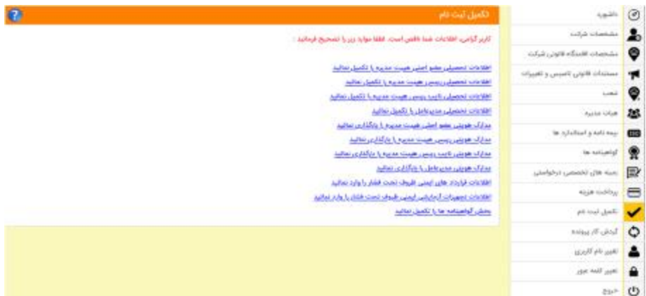
شکل 30- تکمیل ثبت نام

توجه: تکمیل فرایند ثبت نام منوط به اخذ کد رهگیری از سامانه می باشد.