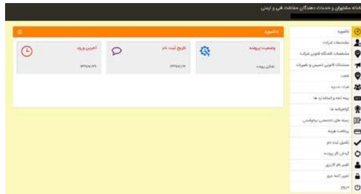
شکل 18- داشبورد ورود اطلاعات کاربر حقوقی

4-4 - ثبت نام متقاضیان عنوان شرکت مشاوران و خدمات‌دهندگان حفاظت فنی و ایمنی: متقاضیان حقوقی بعد از ورود نام کاربری و گذرواژه (کارفرمای شرکتی) وارد داشبورد ثبت نام متقاضیان عنوان مشاوران و خدمات‌دهندگان حفاظت فنی می‌شوند.