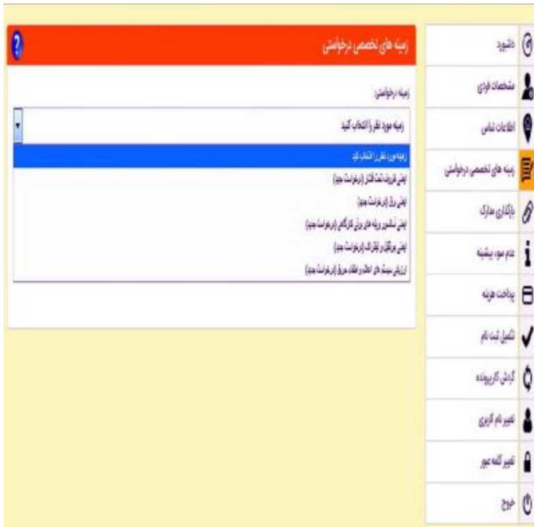
شکل 9- زمینه‌های تخصصی درخواستی برای متقاضیان جدید

عدم رعایت اصل سازگاری رشته تحصیلی متقاضی و سوابق حرفه‌ای معتبر قابل استعلام با ذکر عنوان دقیق شغلی که مستند به لیست بیمه متقاضی در سنوات کاری نباشد، به رد درخواست در کمیته تایید و تشخیص منتج می‌شود.