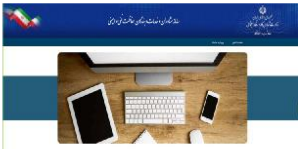
شکل 16- صفحه شروع سامانه

4-1- مراجعه به نشانی اینترنتی https://scp.mcls.gov.ir و نمایش صفحه شکل 16 و انتخاب «ورود به سامانه».