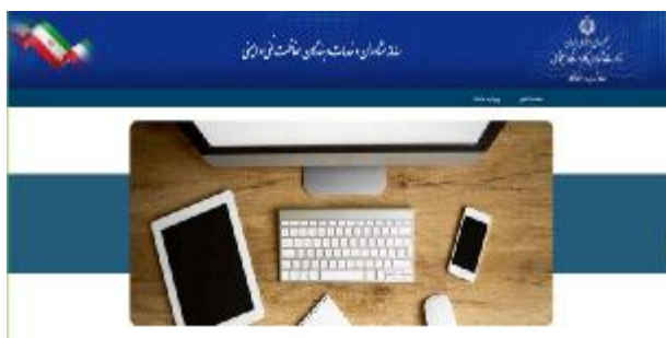
شکل 4- صفحه شروع سامانه

3-1- مراجعه به نشانی اینترنتی https://scp.mcls.gov.ir و نمایش صفحه شکل 4 و انتخاب «ورود به سامانه».