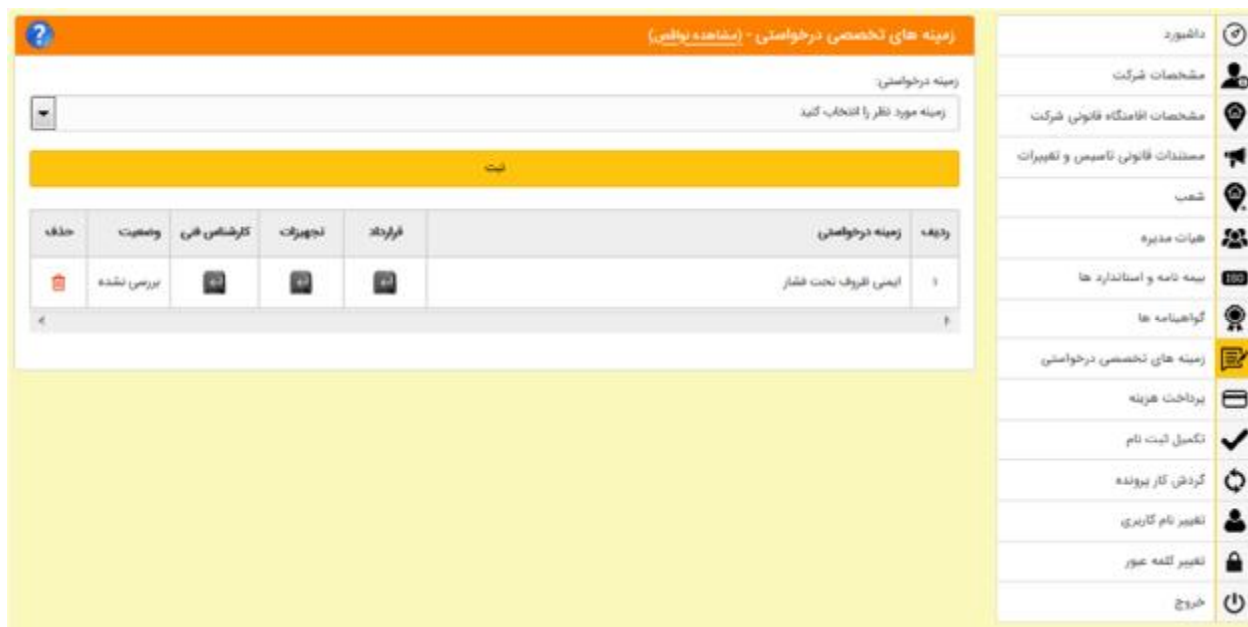
شکل 26- زمینه های تخصصی درخواستی

4-4-8- زمینه های تخصصی درخواستی: در این قسمت، شرکت زمینه های تخصصی درخواستی را اعلام می کند تا در آن زمینه ها بر اساس آیین نامه و دستورالعمل اجرایی آن در صورت داشتن شرایط رتبه بندی شود (شکل 26).