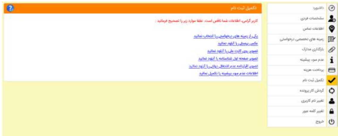
شکل 15- فرم تکمیل ثبت نام

3-4-7- تکمیل ثبت نام: در این قسمت موارد نقص ثبت نام به اطلاع متقاضی رسانده می شود و متقاضی باید با کلیک بر آنها، نسبت به رفع نقص اقدام کند (شکل 15).