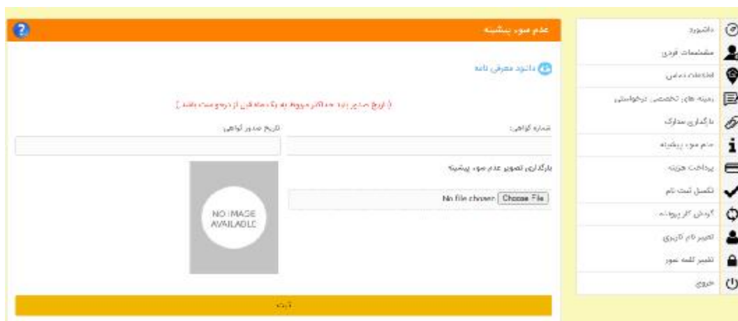
شکل 14- فرم بارگذاری گواهی عدم سوء پیشینه و مشخصات آن