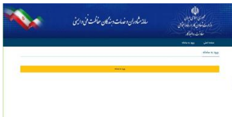
شکل 5- ورود به سامانه

3-3- متقاضیان حقیقی عنوان «کارشناس فنی مجاز» با ورود نام کاربری و گذرواژه احراز هویت شده به صورت «کارگری» وارد مراحل ثبت نام می‌شوند.