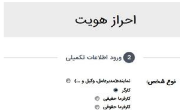
شکل 3- انواع احراز هویت

2-3- بعد از انتخاب احراز هویت الکترونیکی، صفحه شکل 3 به همراه الزامات احراز هویت به نمایش در می آید.