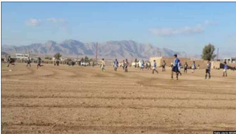
این مسوولان اما درباره این انتقادهای تاکنون اظهار نظر نکرده اند.

شماره از فوتبالستان دایکندی با شعار "محروریت حق دایمی فوتبالستان دایکندی نیست" از عدم همکاری فدراسیون فوتبال در مرکز کشور و عدم توجه مسوولان محلی به این رشته ورزشی شکایت دارند.