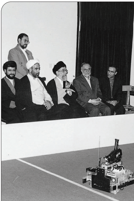
بازدید رهبر انقلاب از مسابقه ربات‌های فوتبال‌بست در جریان حضور در دانشگاه صنعتی شریف (۱۳۷۸/۹/۱)

عزیزان من! از سطحی اندیشی به شدت پرهیز کنید. خصوصیت دانشجو، تعمق و تدقیق است. هر حرفی را که میشنوید، رویش فکر و دقت کنید. چرا در اسلام هست که: «تفکر ساعة خیر من عبادة سبعین سنة»؛ یک ساعت فکر کردن، ارزشش از عبادت سالها بیشتر است؛ به خاطر این که اگر شما فکر کنید، عبادتتان هم معنا پیدا میکند؛ تلاش سازندگان هم معنا پیدا میکند؛ مبارزه‌تان هم معنا پیدا میکند؛ دوستتان را میشناسید، دشمنان را هم میشناسید. عده‌ای میخواهند در هاپوهوی فریادها و شعارها و رنگ و روغنها و رنگ و لعابهای دروغین، مجموعه دانشجویی را به این سمت بکشانند. این برای جنبش و حرکت دانشجویی خطر است. باید فکر کرد. ● ۱۳۷۸/۰۹/۰۱