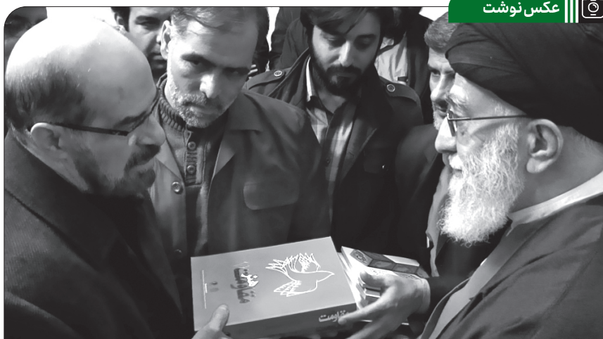
تصویری از گفت و گوی مرحوم حبیب الله صادقی هنرمند انقلابی با رهبر انقلاب

واقعاً به شیخ فضل الله خیلی ظلم شده است... امام نسبت به مرحوم شیخ فضل الله خیلی تبجیل و احترام دارند و به خاطر همان تصلب و شجاعت و دین گرایی کاملش، بدون اغماض آن بزرگوار را تعظیم و تجلیل هم می کنند؛ که این در بیانات خود امام هم آمده است. ● ۱۳۸۲/۰۵/۱۳ ملتی که در شهر تهران ایستادند و تماشا کردند که مجتهد بزرگی مثل شیخ فضل الله نوری را بالای دار بکشند و دم نزدند؛ دیدند که او را با اینکه جزو بانیان و بنیانگذاران و رهبران مشروطه بود، به جرم اینکه با جریان انگلیسی و غرب گرای مشروطیت همراهی نکرد، ضد مشروطه قلمداد کردند - که هنوز هم يك عده قلمزن ها و گوینده ها و نویسنده های ما همین حرف دروغ بی مبنای بی منطق را نشخوار و تکرار می کنند - پنجاه سال بعد چوبش را خوردند. ● ۱۳۸۴/۰۸/۰۸ به مناسبت یازدهم مرداد ماه، سالروز شهادت آیت الله شیخ فضل الله نوری (۱۲۸۸ ه ش)