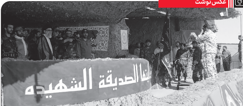
حضور فرمانده کل قوا در مرحله ای اصلی مانور ذوالفقار، ۱۳۷۶/۷/۶ ●