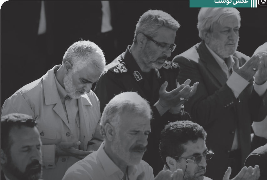
تصویری از آخرین حضور شهید حاج قاسم سلیمانی در نماز عید فطر به امامت رهبر انقلاب اسلامی، ۱۳۹۸/۳/۱۵