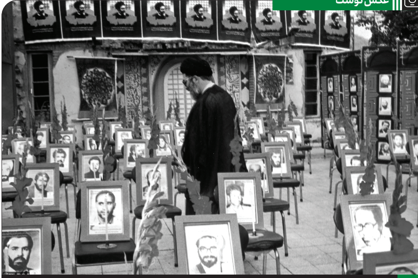
بازدید آیت الله خامنه‌ای از محل حادثه هفتم تیر در حزب جمهوری اسلامی