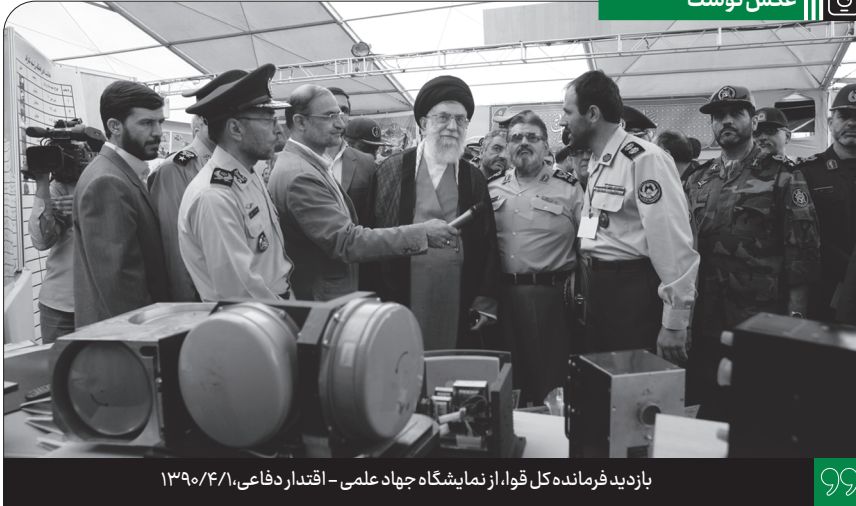
بازدید فرمانده کل قوا، از نمایشگاه جهاد علمی - اقتدار دفاعی، ۱۳۹۰/۴/۱

انتشار به مناسبت ۳۰ مرداد، روز جهانی مسجد