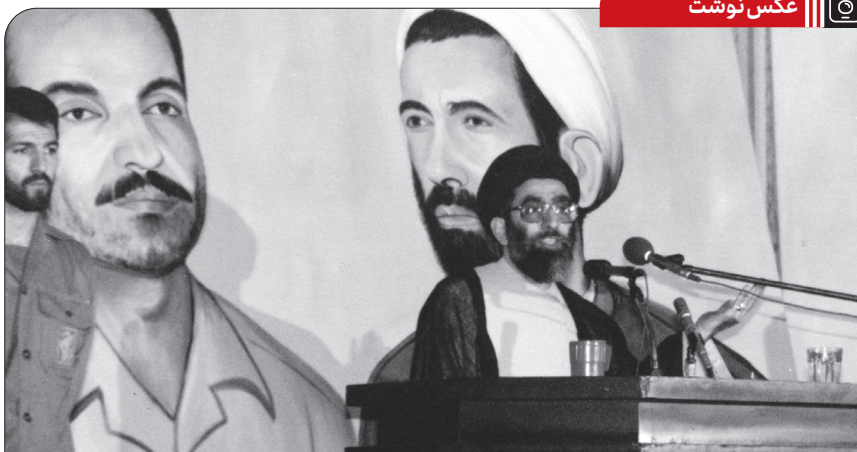
سخنرانی آیت الله خامنه ای در دومین سالگرد شهادت شهیدان رجایی و باهنر (۱۳۶۲/۶/۸)

امام حسن بعد از حادثه ی مکار که ی جنگ، بنا کرد تشکیلات دهی و سازماندهی، آن کاری که آن زمان انجام نشده بود لزومی هم نداشت، امکان هم نداشت، یک سازماندهی عظیم شیعی را به وجود آوردند این همان سازماندهی است که شما در کوفه، در مدینه، در یمن، در خراسان، در مناطق دور دست حتی نشانه های او را می بینید زمان امام حسین و بعد از ماجرای شهادت امام حسین همان سازماندهی بود که ماجرای توابع را به وجود آورد، ماجرای مختار را به وجود آورد، ماجراهای فراوانی را در دنیای اسلام ایجاد کرد که تا آخر هم گذاشت آب خوش از گلو ی خلفای بنی امیه پایین بیاید. این تشکیلات زمان امام حسین بود که امام حسین وقتی شهید میشد میدانست که دنبال خودش یک تشکیلاتی را دارد باقی میگذارد که اینها پرچم را بالا نگه خواهند داشت و نمیگذارند که قضیه لو ت بشود و حقیقت مکتوم بماند. ● ۱۳۶۵/۳/۴ هفتم صفر سالروز شهادت امام حسن مجتبی علیه السلام تسلیت باد